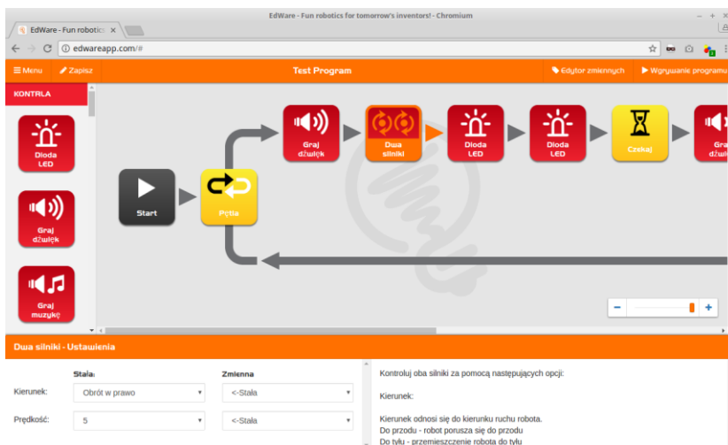
Rysunek 1 Platforma Blockly dla robota http://edwareapp.com